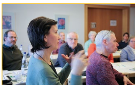
Teilnehmende im Vortrag zu Marketing

Das Interesse an Kirchen nimmt wahrnehmbar zu. Menschen sehnen sich in hektischen Zeiten nach Räumen der Ruhe, nach stillen Plätzen für die Seele, für Besin- nung und Gebet. Kirchen bieten bei Übergängen und Besonderheiten des Lebens Raum für Erfahrungen. Durch die kirchenpädagogische Ausbildung zur*in zertifizierten Kirchenführer*in können die Teil- nehmer*innen die Kirche sowohl als Bauwerk als auch als spirituellen Ort für andere erlebbar machen. Fernab vom All- tagstress, mit anderen Augen und mit allen Sinnen.