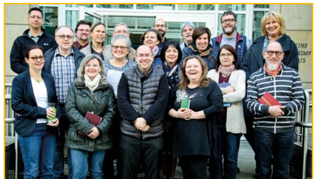
Teilnehmende der Laien-Uni Theologie Pfalz beim Studientag im Februar 2019