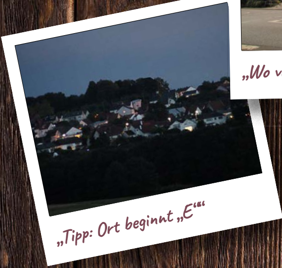
„Tipp: Ort beginnt „E““