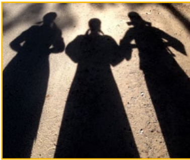
Entschlossenheit, Motivation und Identifikation mit der Rolle bei den „Katharinen“

So schnell Menschen heute per Knopfdruck das geschriebene Wort um den vernetzten Globus senden können, so lange dauerte das Versenden von Nachrichten in Zeiten vor Big Data . Zitate Martin Luthers , einige ermunternd, andere nachdenklich stimmend, standen Pate für das Konzept der „ bewegten und bewegenden “ Worte.