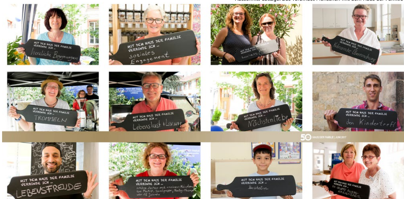
Ausschnitt Collage: Das verbindet Menschen mit dem Haus der Familie

Bei der Entwicklung der Angebote in den letzten Jahren fiel auf, wie die Bereiche Erziehung, Rollenverständnis von Männern und Frauen, Veränderungen in der Berufstätigkeit, ein sich veränderndes Körperbewusstsein sowie die Frage nach sinnvoller Freizeitgestaltung die jeweiligen Veränderungen innerhalb der Gesellschaft widerspiegeln. Aufspüren, was Menschen bewegt und zudem bieten, was Familien in ihrer jeweiligen Situation brauchen, bleibt unsere Herausforderung im Haus der Familie.