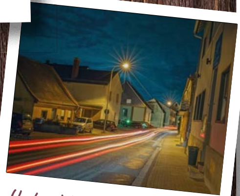
„Und welcher Ort ist das?“