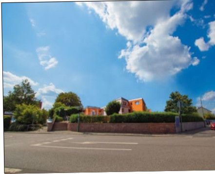
„Wo verschwand die Kirche?“