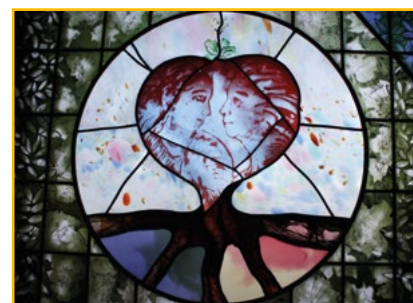
Das Coverfoto des Flyers zeigt das Fenster im Diakonissenhaus Speyer

Bei zwei aus- gebuchten Wochenendseminaren – seitens des Bildungsdezernenten 2017 und 2018 finanziell unterstützt – erhielten Men- schen Hand- werkszeug, Kraft und Inspiration für Glauben und Leben.