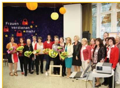
Gruppenfoto zu Ende der Veranstaltung 2018

Politische Bildung unterhaltsam verpackt: „ Frauen verdienen mehr! “ Jedes Jahr veranstalten wir als Mitglied im Arbeitskreis „Frauen und Erwerbsarbeit“ gemeinsam mit vielen Kooperationspartnern in Pirmasens unter diesem Motto einen Abend mit „Abendbrot in Rot“, Kabarett und Podiumsdiskussion anlässlich des Tages, der an die Lohnungleichheit zwischen Männern und Frauen erinnert. Komplexe Sachverhalte werden verständlich und zielgruppengerecht aufbereitet: