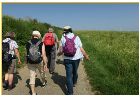
Nachhaltigkeitswanderung im Juni 2018

Neben jeweils sechs Betriebsbesuchen pro Jahr haben wir als neues Format im Berichtszeitraum eine Wanderung unter dem Motto „Schritt für Schritt zu einer nachhaltigkeitsbewussten Gesellschaft“ durchgeführt. Diese startete mit dem Weg der Nachhaltigkeit durch das Nordpfälzer Bergland, es wur-